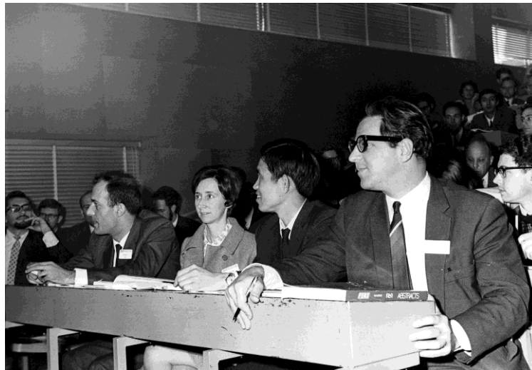
Margarita Salas y Eladio Viñuela, junto a otros congresistas