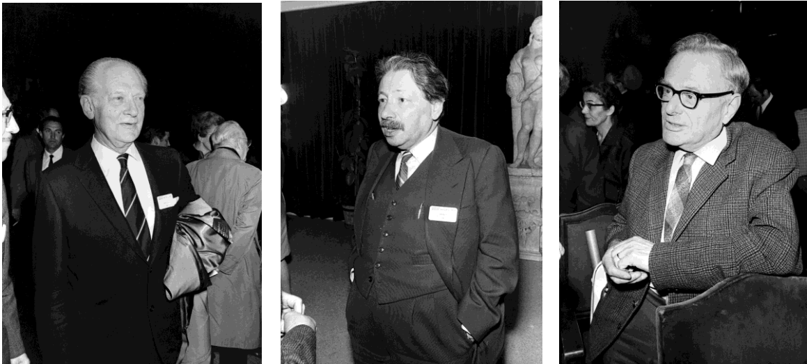
Carl F. Cori, Ernst Chain y Hans Krebs durante el Congreso

Una de las curiosidades que cabe destacar es que las ilustraciones para el cartel y el programa de mano corrieron a cargo del pintor Salvador Dalí. Además, la Fábrica Nacional de Moneda y Timbre elaboró, con ocasión del Congreso, un sello conmemorativo del que se editaron ocho millones de ejemplares, que mostraba la representación esquemática de la molécula del ADN a varios colores, e incluía un cuadro con los 64 tripletes que componen la clave genética.