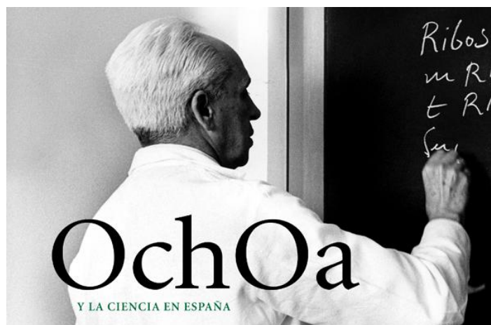
Severo Ochoa anota en la pizarra secuencias del mensaje genético mientras imparte una clase en la Facultad de Medicina de la Universidad de Nueva York, 1967