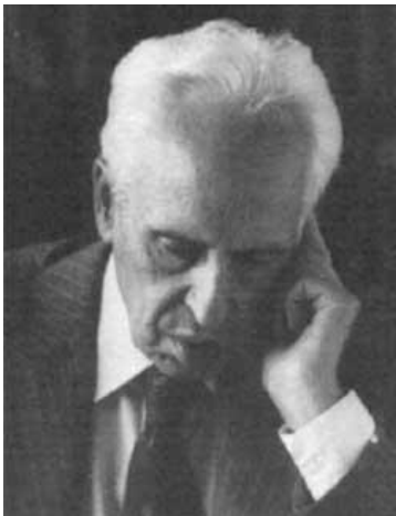
Foto elegida por Severo Ochoa para acompañar a su autobiografía titulada: “The pursuit of a hobby” y publicada en Ann. Rev. Biochem. 1980, vol. 49, pp 1-30