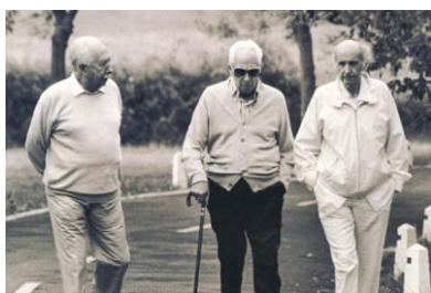
Francisco Grande Covián, Severo Ochoa y Santiago Grisolia, paseando por los alrededores del Palacio de la Granda, Avilés, Asturias, 1986

Los primeros trabajos de Ochoa en la Universidad de Nueva York fueron sobre la fosforilación oxidativa. Sin embargo, Severo pensaba que el mecanismo de la fosforilación oxidativa no se entendería sin el conocimiento de las reacciones enzimáticas implicadas en oxidación y en especial, aquellas acopladas a fosforilación. Severo decidió estudiar la isocitrato deshidrogenasa, descubriendo que, por fijación de CO 2 a \alpha -cetoglutarato, se forma isocitrato, pudiendo seguir la reacción por la oxidación de NADPH medida por espectrofotometría. Cuenta Severo en su autobiografía (2) que cuando vio por primera vez moverse la aguja del espectrofotómetro, lo que indicaba la oxidación del NADPH, se emocionó tanto que salió al pasillo del